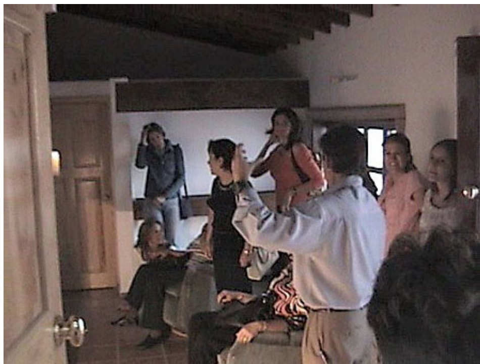
El "Cuarto Cósmico"