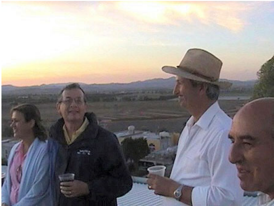
En la azotea...