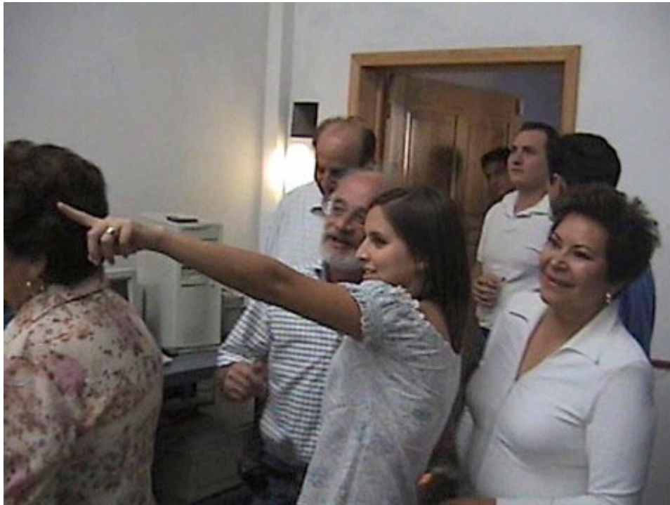
Por allá entra el sol...