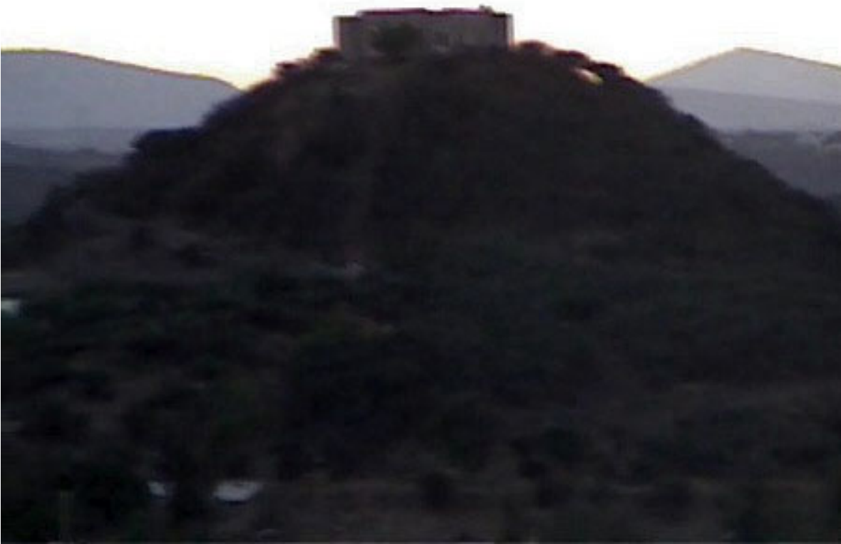
La Pirámide desde la azotea...